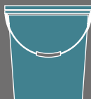
Weitere Gebinde wie Eimer oder Fässer auf Anfrage möglich